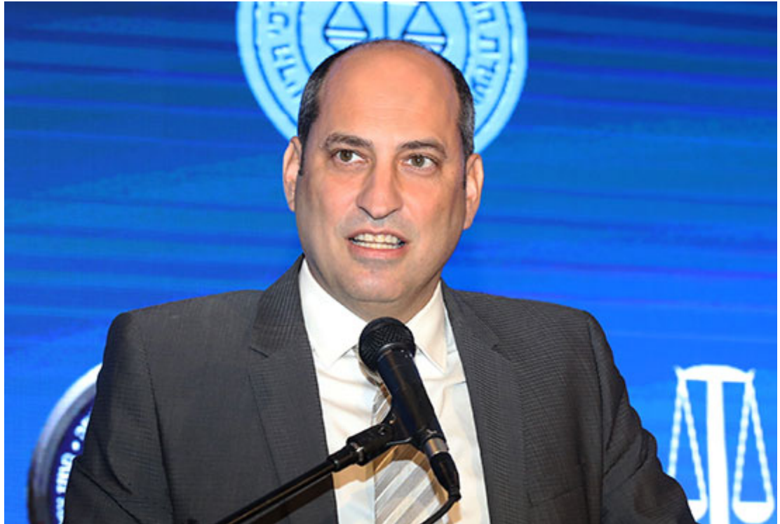
פרטונות (1): שופט "מוקד" שדוחק להתפטר